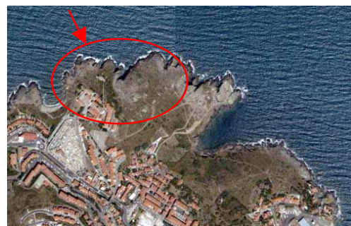
Localisation de la zone prospectée au large du Cap Gros, en direction de l'anse de la Mauresque